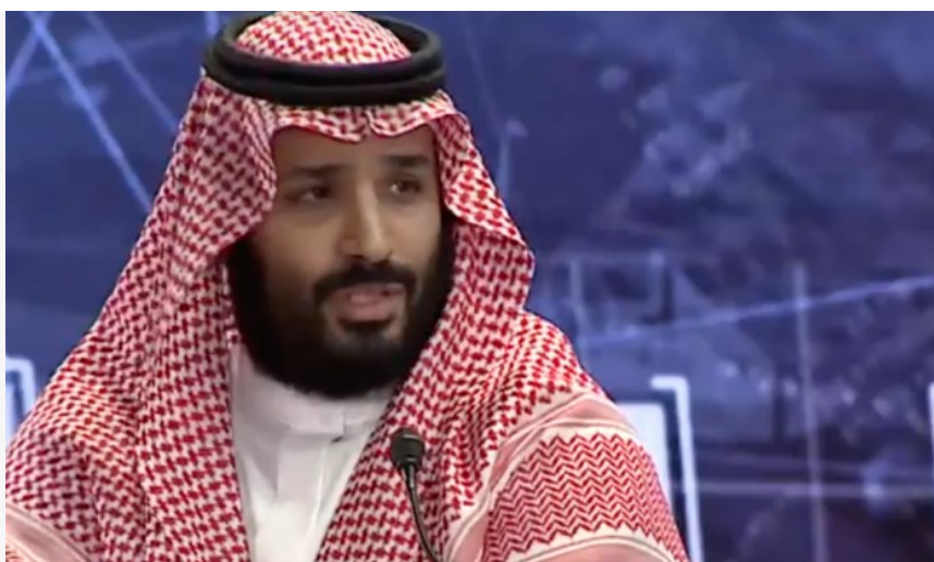
Saudi Crown Prince Muhammad bin Salman nel 2018.

5 ° AGGIORNAMENTO: Almeno 150 membri della famiglia reale saudita sono stati infettati e di conseguenza Riyadh sta cercando di porre fine al disastroso assalto di cinque anni allo Yemen.